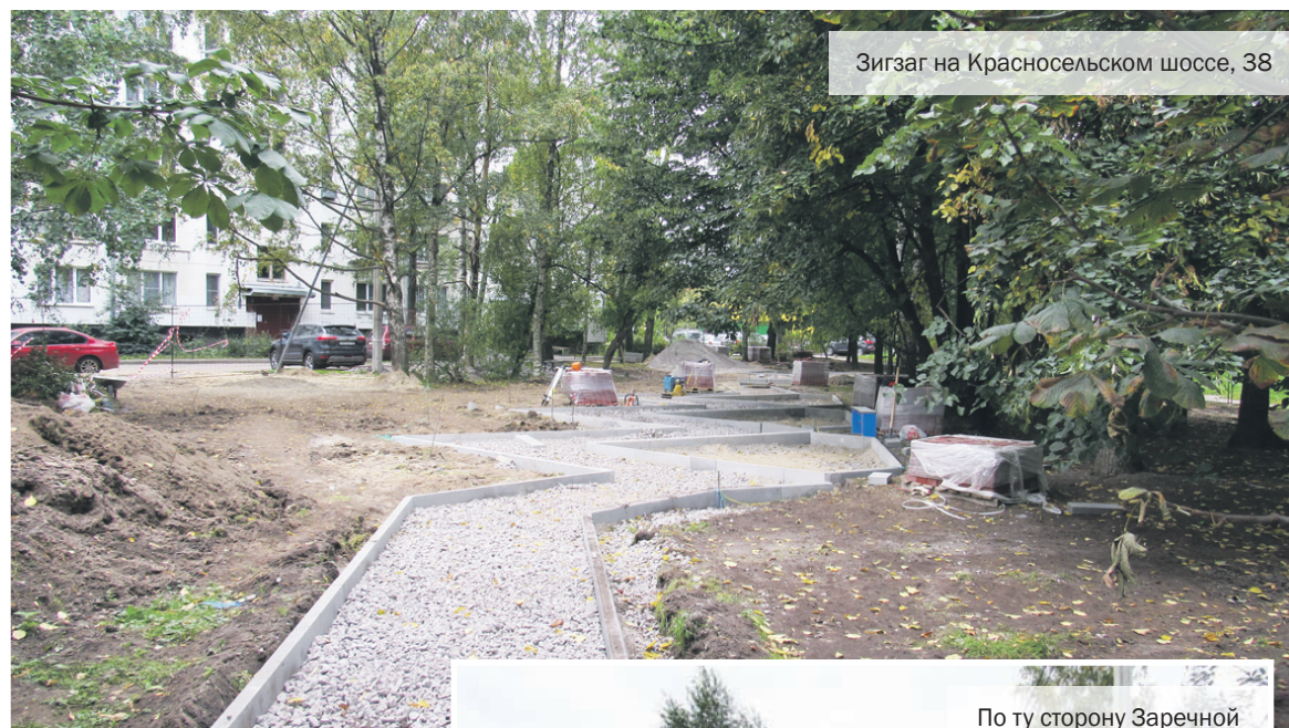
Зигзаг на Красносельском шоссе, 38

В Горелово реализуется ряд проектов по благоустройству территории, которые не столько радуют, сколько настораживают жителей.