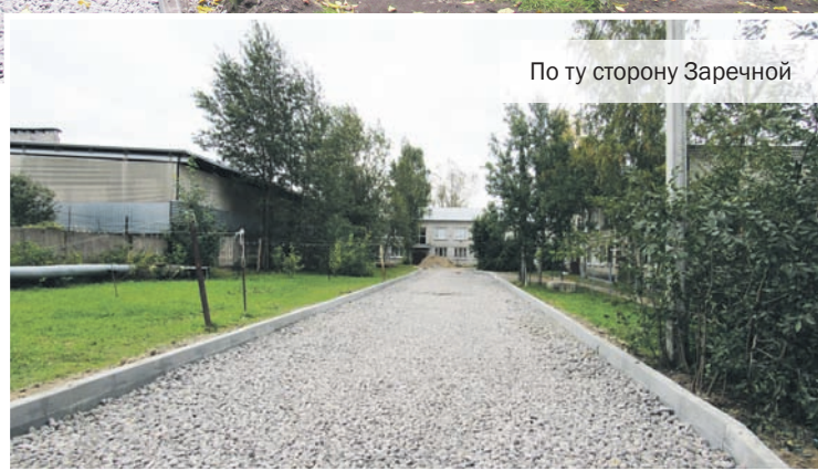
По ту сторону Заречной

Нарисовано симпатично, цена подряда адекватная, но проживающий в прилегающих к будущему объекту муниципального благоустройства домах народ обеспокоен. Причина не столько в грубом стиле ломаной дорожки, никак не подходящей к спокойному ландшафту этого парка, сколько в садовых диванах, которых, судя по техзаданию, должно быть около пяти на общую сумму 88500 руб. Здешние жители резонно опасаются, как бы эти диваны не облюбовали местные выпивохи и не стали бы беспокоить мирных граждан своими громкими гулянками. Ведь прецедент уже был. В своё время на этом месте тоже стояли садовые скамейки. Не такие красивые и дорогие, как теперь. Но алкоголиков и наркоманов это не отпугивало, они тусовались там почти круглосуточно, пока скамейки куда-то не исчезли, наверняка с лёгкой руки уставших жильцов. Так что граждане даже и не знают, во что выльется для них забота муниципалов, и не светит ли новым диванам та же участь, что и предыдущим.